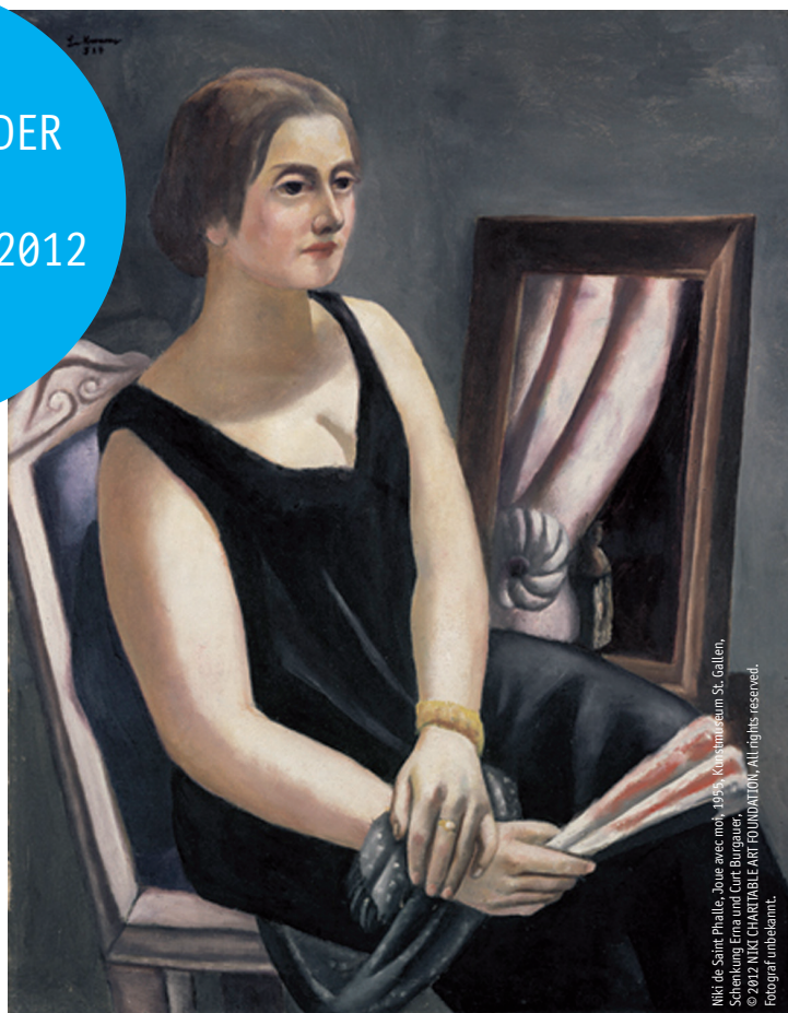
Niki de Saint Phalle, Joue avec moi, 1954, Kunstmuseum St. Gallen, Schenkung Erna und Curt Burgauer, © 2012 NIJK CHARITABLE ART FOUNDATION, All rights reserved.

PINAKOTHEK DER MODERNE, 30. 3. – 15. 7. 2012