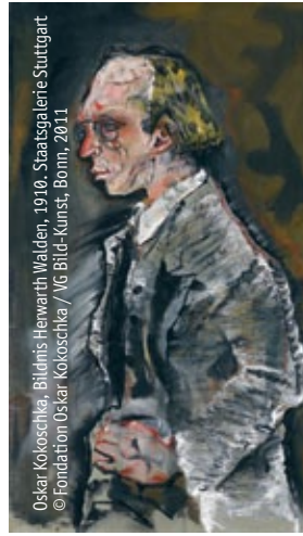
Oskar Kokoschka, Bildnis Herwarth Walden, 1910, Staatsgalerie Stuttgart © Fondation Oskar Kokoschka / VG Bild-Kunst, Bonn, 2011