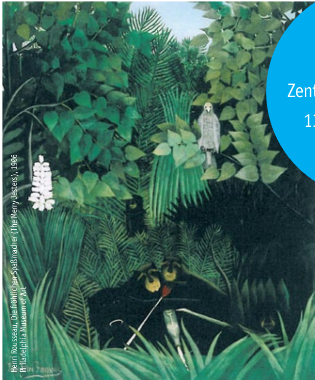
Henri Rousseau, Die frühlichen Spatzmacher (The Merry Jesters), 1906 Philadelphia Museum of Art

DER STURM Zentrum der Avantgarde 13.03 - 10.06.2012