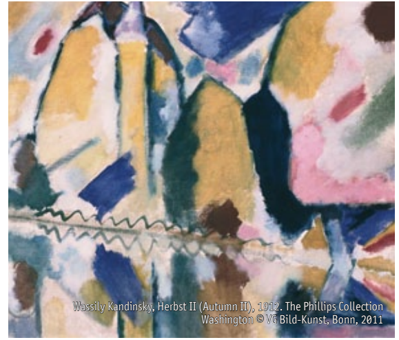
Wassily Kandinsky, Herbst II (Autumn II), 1912, The Phillips Collection Washington © VG Bild-Kunst, Bonn, 2011