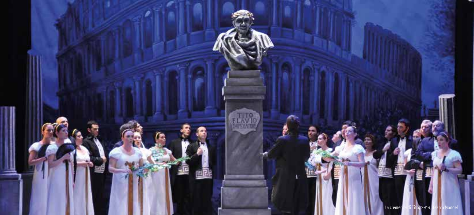
La clemenza di Tito, 2014, Teatru Manoel