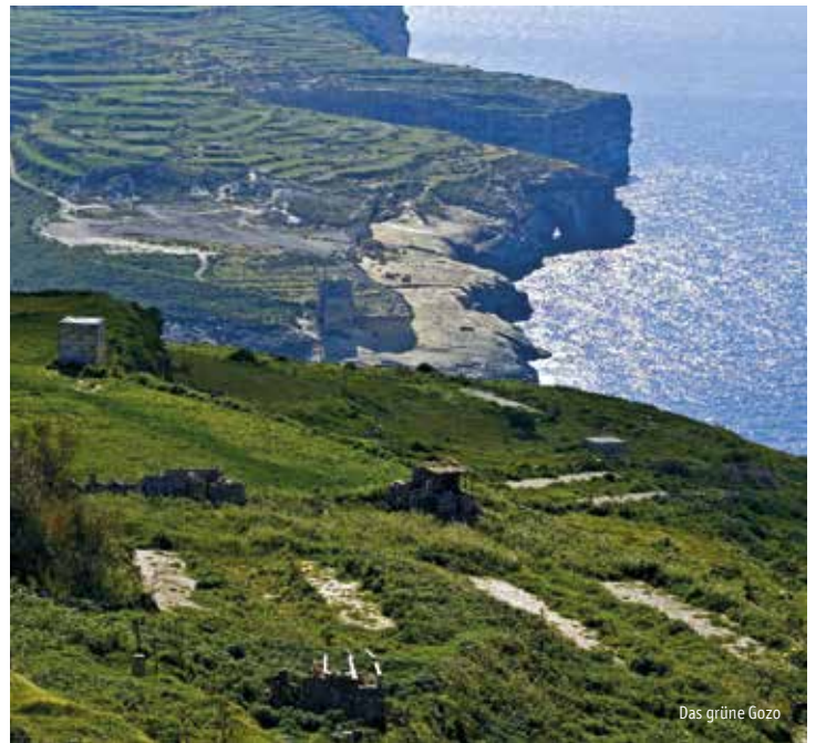
Das grüne Gozo