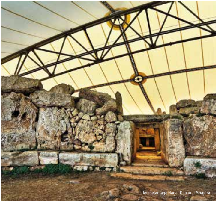
Tempelanlage Hagar Qim und Mnajdra