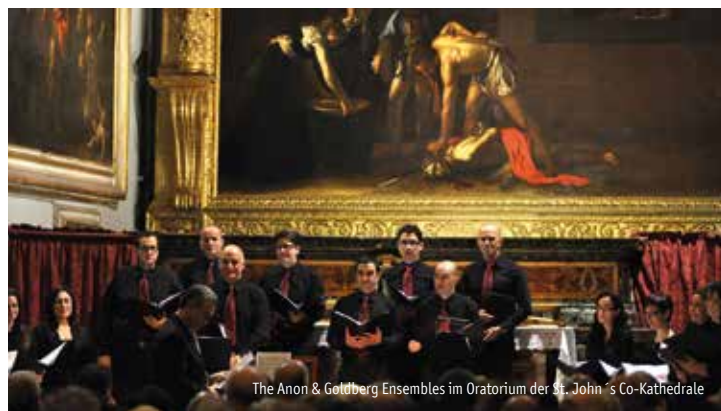
The Anon & Goldberg Ensembles im Oratorium der St. John's Co-Kathedrale