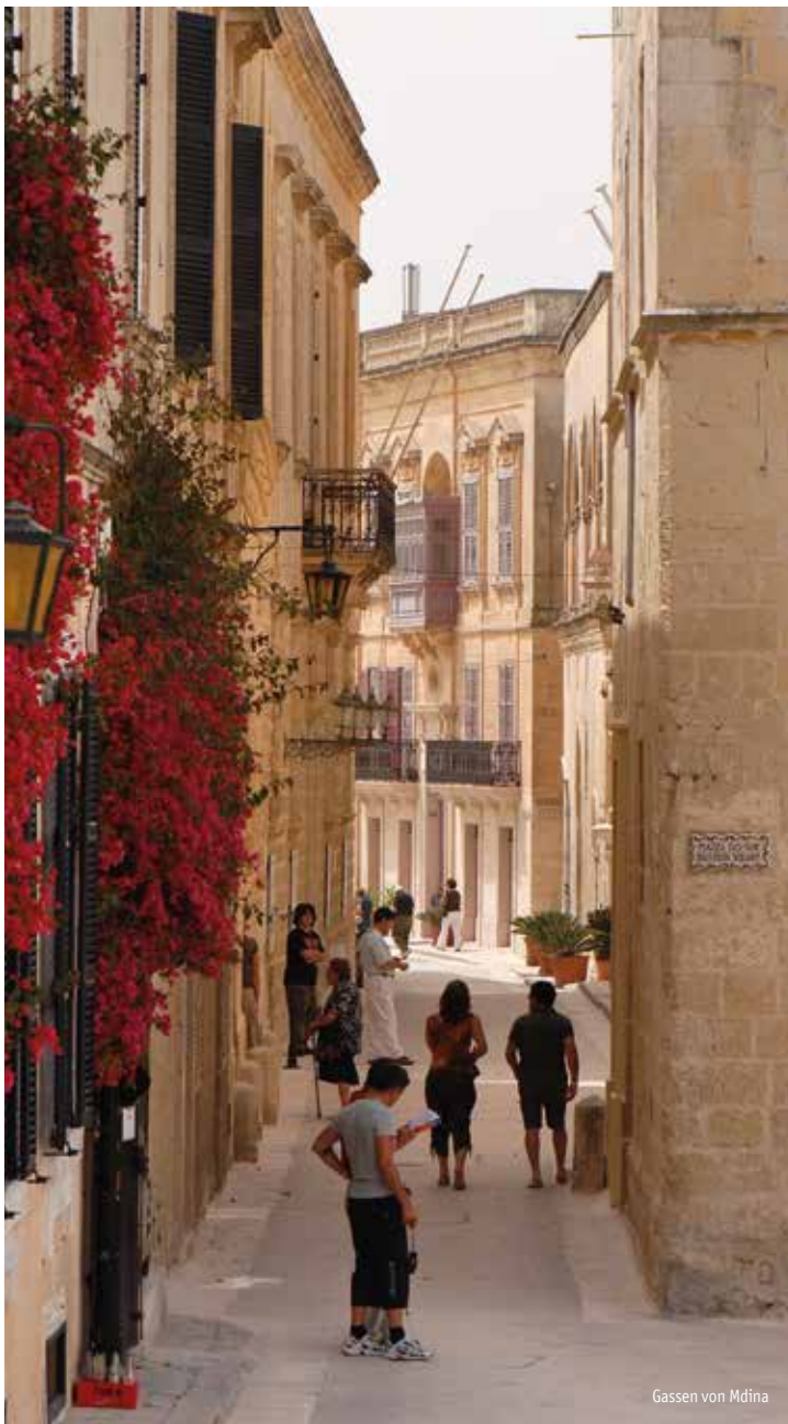
Gassen von Mdina

Jedes Jahr im März zieht das Malta-Opernfestival Musikliebhaber aus der ganzen Welt an. Großartige Aufführungen und herausragende Künstler bieten einen Musikgenuss für höchste Ansprüche. Den prächtigen Rahmen bildet das Manoel Theater, eines der ältesten noch bespielten Opernhäuser in Europa. Hier wird im kommenden Jahr die Oper "Le Nozze di Figaro" aufgeführt. Darüber hinaus erwartet Sie ein Orgelkonzert in Mdina sowie ein Duett von Harfe und Flöte in Valletta. Freuen Sie sich auf eine besondere Kombination aus Landschaft, Kulturschätzen und musikalischen Leckerbissen an ganz besonderen Orten.