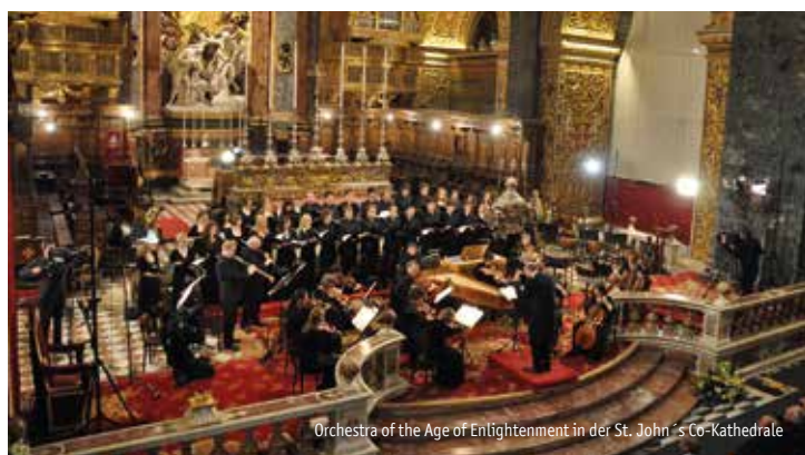
Orchestra of the Age of Enlightenment in der St. John's Co-Kathedrale