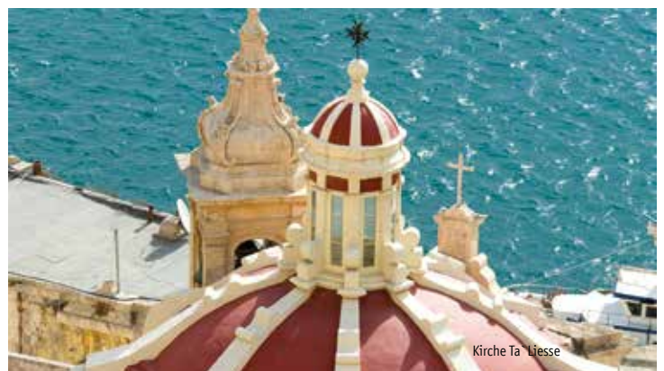
Kirche Ta' Liesse