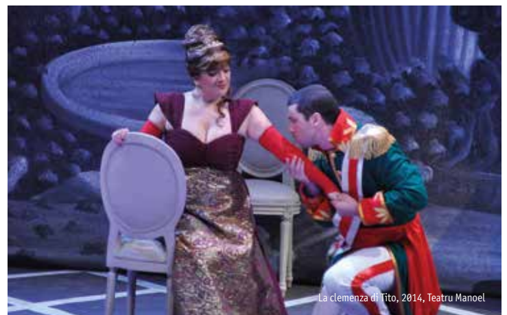
La clemenza di Tito, 2014, Teatru Manoel