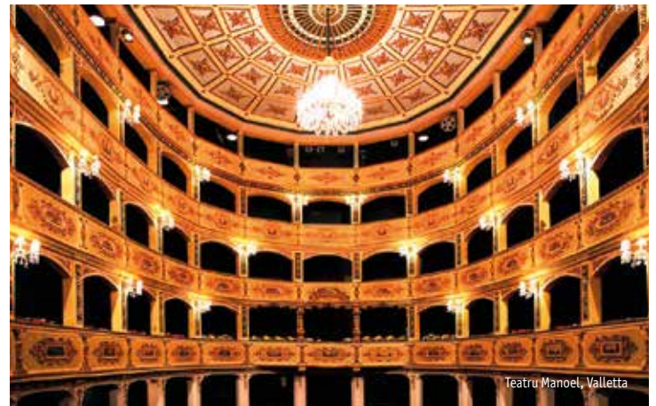
Teatru Manoel, Valletta