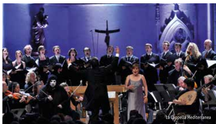
La Cappella Mediterranea