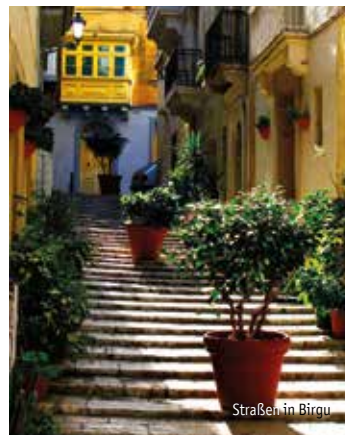
Straßen in Birgu