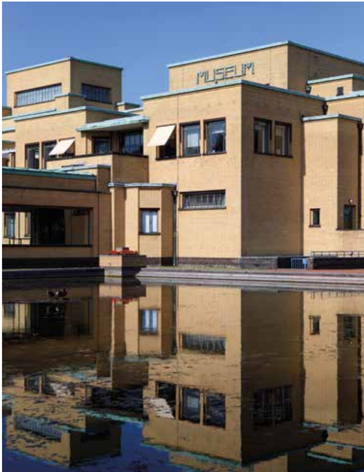
Gemeentemuseum Den Haag