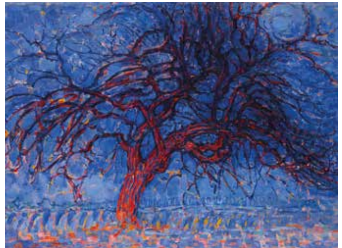
Gemeentemuseum Den Haag, Piet Mondriaan, Evening: The red tree.

Eine vollständige Übersicht über alle Ausstellungen im Jubiläumsjahr finden Sie unter www.mondriaantodutchdesign.com