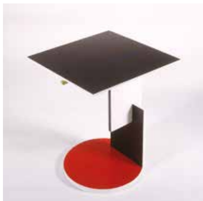
Cocktail table, 1923, Gerrit Rietveld, Centraal Museum, Utrecht

Mondrian, Rietveld, van Doesburg und van der Leek – gleich vier der wichtigsten Repräsentanten von De Stijl sind in der Region Utrecht geboren. Heute können Sie den Werken dieser Künstler hier auf Schritt und Tritt begegnen: Bestaunen Sie im Centraal Museum Utrecht die weltweit größte Rietveld-Kollektion – etwa den weltberühmten Rietveld Stuhl. In Utrecht finden Sie auch das wohl wichtigste Bauwerk der De Stijl -Bewegung: das 1924 erbaute Rietveld-Schröder-Haus, das seit 2000 auf der UNESCO-Welterbeliste steht.