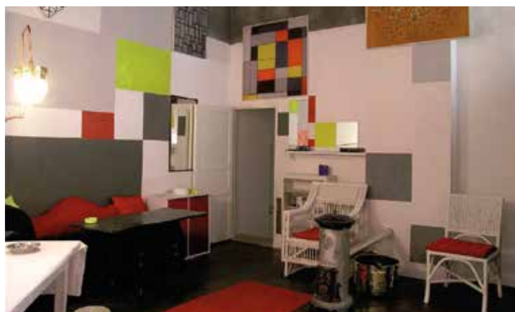
Mondriaan Haus (1872), Paris Atelier, Amersfoort

Unweit von Utrecht in Amersfoort steht das Geburtshaus von Pieter Cornelis Mondriaan (der sich 1912 in Piet Mondrian umbenannte). Als einer der Höhepunkte des Jubiläumsjahres wird hier 2017 das Mondriaanhuis nach umfangreicher Modernisierung wieder eröffnet. Auch die Kunsthalle KADe, selbst spannendes Zeugnis moderner niederländischer Baukunst, steht ganz im Zeichen von De Stijl . Ein besonderes architektonisches Spätwerk Rietvelds ist der Zonnehof Pavillon, der im Jubiläumsjahr in das Rahmenprogramm eingebunden wird.