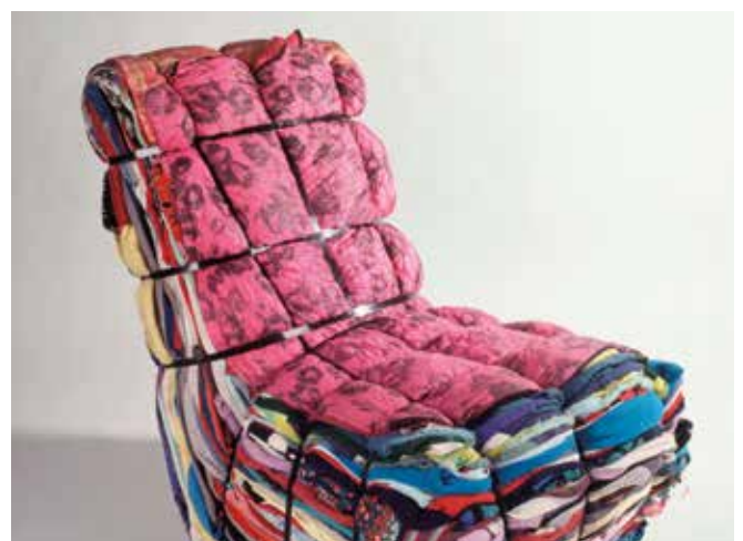
Rag Chair, Tejo Remy, 1991, TextielMuseum