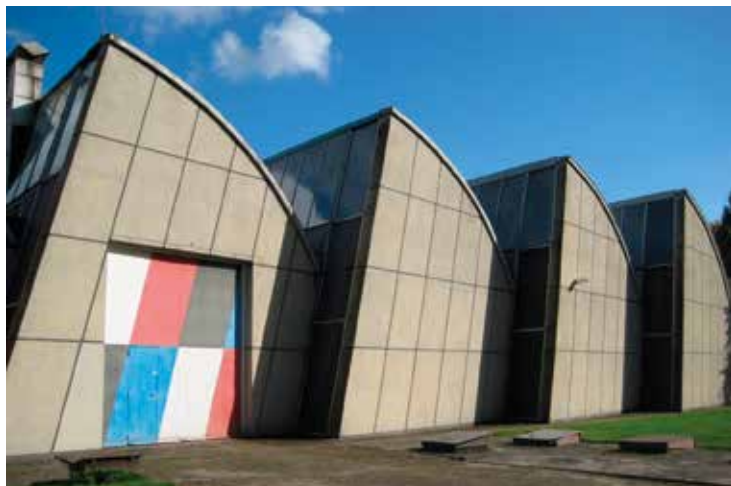
Textilfabrik De Ploeg, Bergeijk