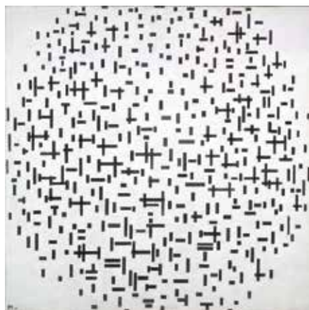
Piet Mondrian, Composition in line, second state, 1916-1917, Kröller-Müller Museum

Das Kröller-Müller Museum ist eine wahre Schatzkammer von De Stijl . Das einzigartige Museum verfügt über zahlreiche Spitzenwerke von Piet Mondrian, Theo van Doesburg und Bart van der Leek. Darüber hinaus besitzt das Museum die zweitgrößte Van-Gogh-Sammlung der Welt und Meisterwerke moderner Künstler wie Monet, Seurat und Picasso und ist umgeben von einem der größten Skulpturenparks Europas. Hier findet man auch den 1954 von Rietveld errichteten Soonsbeek-Pavillons der nach dem Skulpturenfestival in Arnhem seine zweite Heimat im Park des Kröller-Müller-Museums in Otterlo gefunden hat.