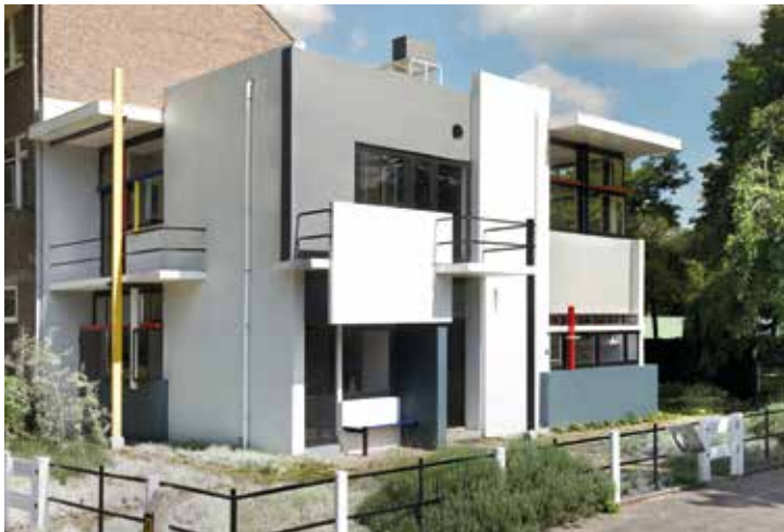
Rietveld Schröder Haus (1924), Gerrit Rietveld, Centraal Museum, Utrecht