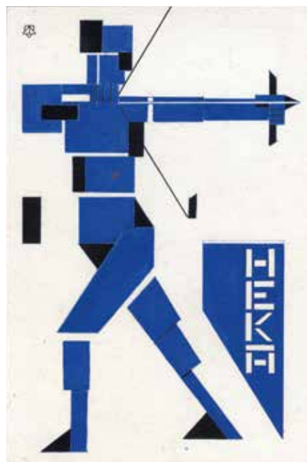
Theo van Doesburg, the archer, 1921, Museum Dr8888, Friesland

Auch das friesische Städtchen Drachten ist eng mit De Stijl verbunden: Hier realisierte Theo van Doesburg seinen ersten großen Auftrag: Er gestaltete sechzehn Mittelklassehäuser sowohl innen als auch außen in den typischen Primärfarben von De Stijl (Rot, Gelb, Blau). Eines dieser farbenfrohen Häuser, das Van Doesburg-Rinsema-Haus, dient ab 2017 als Museumswohnhäuser. Das unweit der Siedlung entstandene Museum Drachten, auch Museum Dr8888 genannt, verfügt über umfangreiche Sammlungen der Kunstrichtungen De Stijl und Dada.