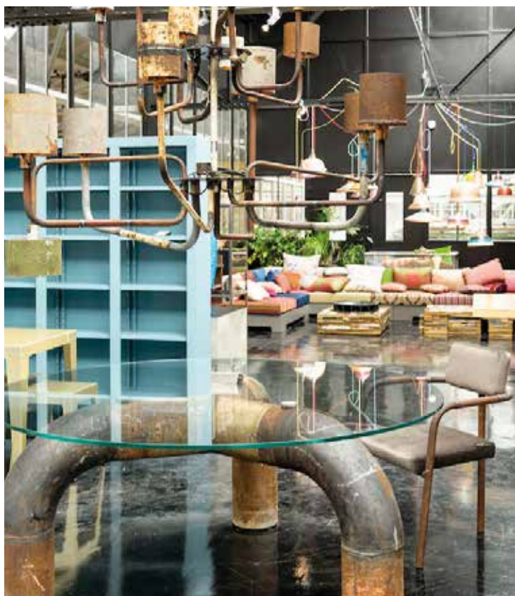
Dutch Design Week, Piet Hein Eek Studio

Die Provinz Brabant rund um Eindhoven, Den Bosch, Breda, Tilburg und Helmond gilt als DIE Design-Region Hollands. Sie bildet eine Verbindung zwischen dem Erbe der De Stijl -Bewegung und modernem Design. Mit einem Fokus auf 25 Jahre Dutch Design , den Auswirkungen von Design und Kunst auf gesellschaftliche Herausforderungen sowie zukünftige Innovationen wird dem Besucher ein einzigartiger Einblick in die Welt des Dutch Design geboten. Erkunden Sie hier die niederländische Kreativität: von historischen De Stijl-Bauten wie der Ploeg-Fabrik in Bergeijk, über das Vanabbe Museum in Eindhoven, das TextielMuseum oder das Europäische Werkzentrum für Keramik bis hin zur Design Academy Eindhoven, der wohl berühmtesten Design-Ausbildungsstätte der Welt. Besonders im Jubiläumsjahr kann man hier renommierten Designern über die Schulter schauen und in vielen Ausstellungen und Festivals Kreativität live erleben.